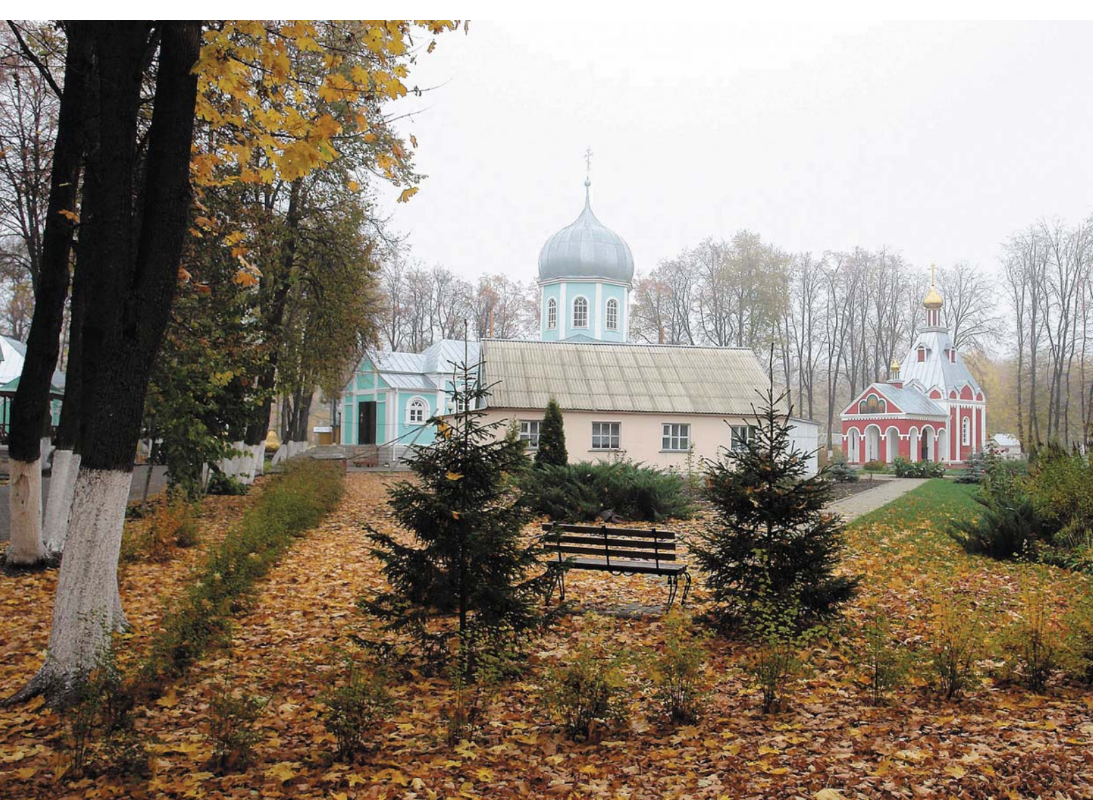
Свято-Серафимо-Саровский монастырь. Воронежская область, Грибановский район.

Над ним впервые великий старец Серафим проявил свою чудотворную исцеляющую силу.